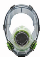
Maschere intere BLS 5700 - BLS 5600