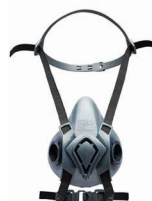
Semimaschere BLS 4000ne>xt S - BLS 4000ne>xt R